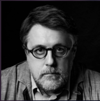
Vitaly Mansky RUS Regisseur