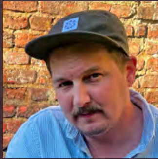
Studio Schmitt (ZDFneo)