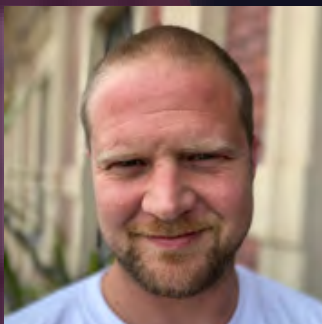
Michael Sand All Artists Agency

Heute Hamburg, morgen Berlin - das Leben von Künstler:innen bedeutet, viel auf Reisen zu sein. Doch wie funktioniert das Tourleben und wer steht hinter dieser Planung?