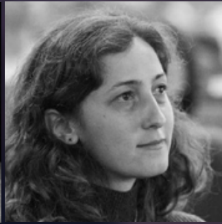
Galina Stepanova Hypermarket Film