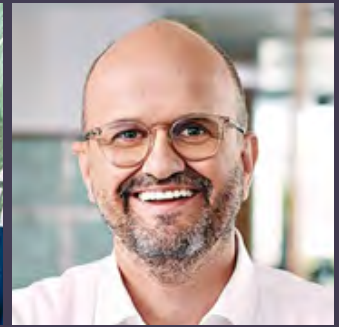
Grenzen und Trends im Genre True Crime

Christoph Richter filmpool entertainment