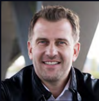
René Kindermann Sender & Empfänger

Eine Sportübertragung im Fernsehen ohne Moderation? Unvorstellbar. Im Workshop „SPEAK, PRESENT, ENTERTAIN – Sportmoderation und -kommentar“ erfahrt ihr von Moderator René Kindermann, bekannt aus der Sportschau und Sport im Osten, wie man eine Sportveranstaltung wie die Olympischen Spiele kommentiert. Anschließend dürft ihr selbst die Moderation eines Olympiafinales durchführen, euer gelerntes Wissen anwenden und eure Versuche von einem Experten beurteilen lassen. Vielleicht sitzt ihr ja dann 2024 selbst mit im Olympiastudio in Paris.