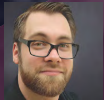
Steffen Kutzner CORRECTIV

Ihr werdet lernen, wie man wirkliches Fact-Checking betreibt, Fake News enttarnt und die generellen Grundlagen der Quellenarbeit und den Umgang mit Desinformationen.