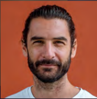
Studio Schmitt (ZDFneo)